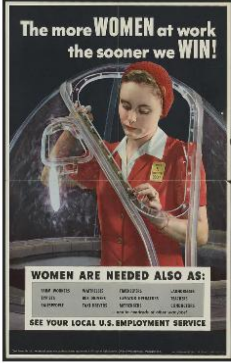
A U.S. Employment Service recruitment poster featuring a woman.